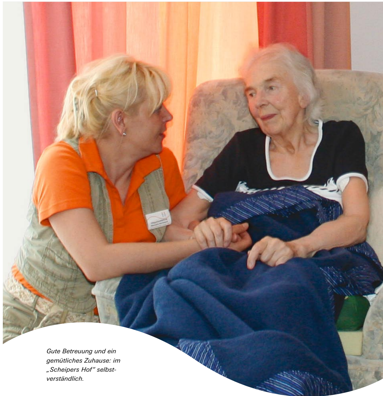
Gute Betreuung und ein gemütliches Zuhause: im „Scheipers Hof“ selbst- verständlich.