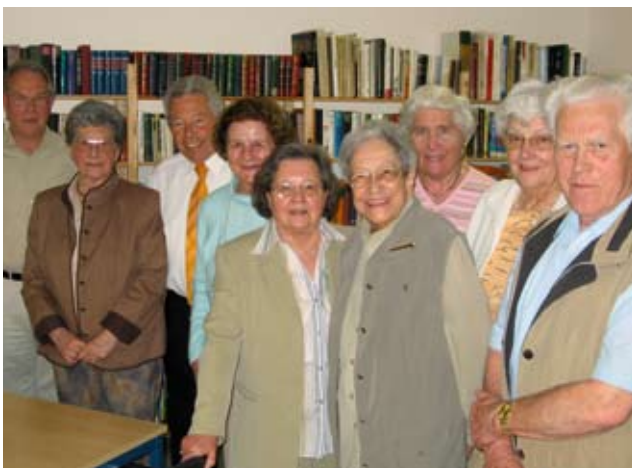
Der „Förderverein Betreutes Wohnen Miteinander-Füreinander e. V.“ engagiert sich für die Senioren in der Einrichtung.

Natürlich spielt sich das Leben nicht nur innerhalb der Wohneinrichtung ab. Über den Förderverein besteht die Möglichkeit, an vielfältigen Aktivitäten teilzunehmen, wie z. B. unserem Singkreis, Veranstaltungen in der Stadt, gemütlichem Beisammensein am Stammtisch oder an gemeinschaftlichen Ausflügen in die reizvolle Umgebung von Menden.